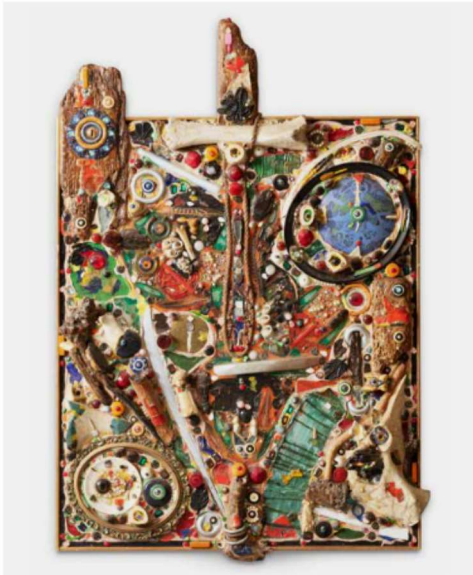
Alfonso Ossorio, Untitled , 1963.

Le ministère de la Culture a refusé d'autoriser l'exportation d'un ensemble de dix-neuf œuvres relevant des « Arts incohérents », les classant trésor national. Elles sont les seuls témoins connus à ce jour de ce mouvement fait d'impertinence et d'humeur joyeuse, à l'initiative de Jules Lévy, rédacteur en chef du Chat noir . André Breton y voyait la préfiguration des avant-gardes contestataires du XX e siècle, dada et surréalistes au premier chef. Deux œuvres se distinguent dans cet ensemble : Combat de nègres, pendant la nuit du dramaturge Paul Bilhaud, toile entièrement noire, considérée comme le premier monochrome de l'histoire de la peinture ; et Des souteneurs encore dans la force de l'âge et le ventre dans l'herbe boivent de l'absinthe d'Alphonse Allais, constituée d'un rideau de fiacre vert, préfiguration des ready-made de Duchamp. « Le délai de trente mois ouvert par cette procédure de refus d'exportation permettra d'approfondir le parcours et la connaissance de ces œuvres remarquables, qui ont vocation à venir enrichir (...) le musée d'Orsay », a déclaré le ministre de la Culture, Roselyne Bachelot. S.R.